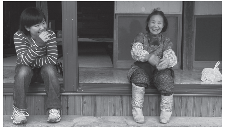
Vuorten viisaat -elokuvan taustalla soi suomalaisen lauluyhtye Rajattoman musiikkia .

Jokaisen sanan, ilmeen ja eleen takaa kamera vangitsee henkilöiden aidot tunteet. Katsoin valkokankaan läpi näiden ihmisten sieluun, joka ei voinut valehdella. Huomasin, että meillä jokaisella on samankaltaisia aja-