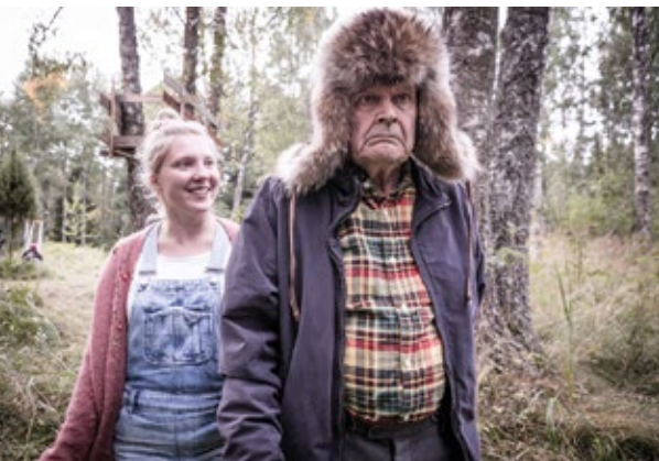
ILOSIA AIKOJA, MIELENSÄPAHOITTAJA