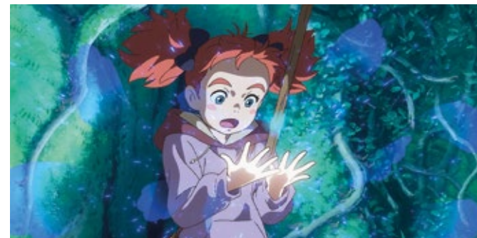
MARY JA NOIDANKUKKA