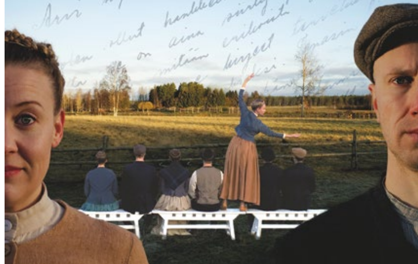
SUN RAKKAUTES TÄHDEN