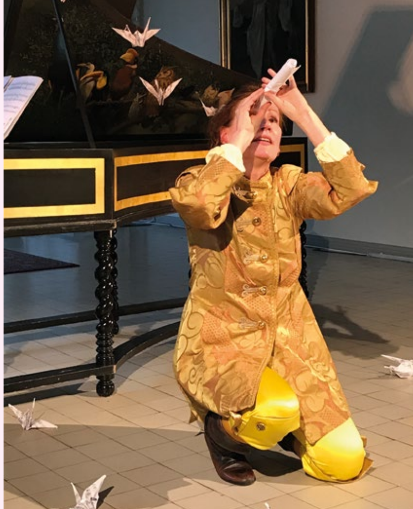
JOUEZ! - MOLIÈREN MATKASSA

komediaa, karjapaimenia, näyttämöavustajia ja rapuja.