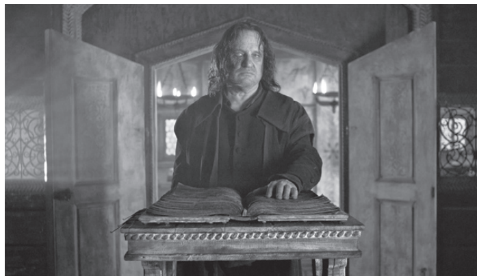
Mylläriellä on synkkiä salaisuuksia.

Esitykset: Plaza 5, ke 18.11, klo 13.00 pe 20.11, klo 17.00 la 21.11, klo 18.00